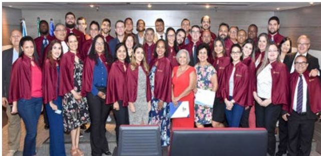
Os novos e os antigos Profissionais da Contabilidade se unem aos membros do CRCRJ